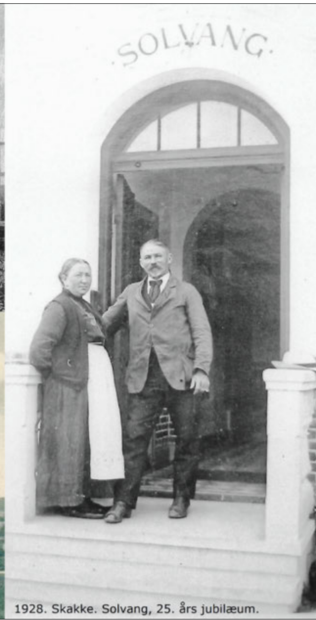
1928. Skakke. Solvang, 25. års jubilæum.