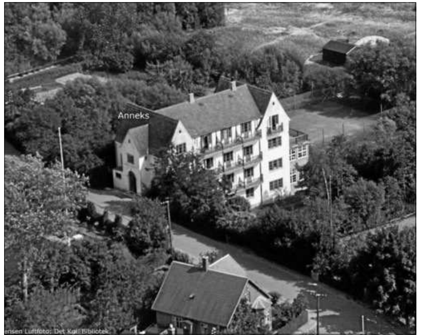
Hotel Udsigten på Klintevej i Faxe Ladeplads fotograferet fra luften af Sylvest Hansen Luftfoto i 1950.