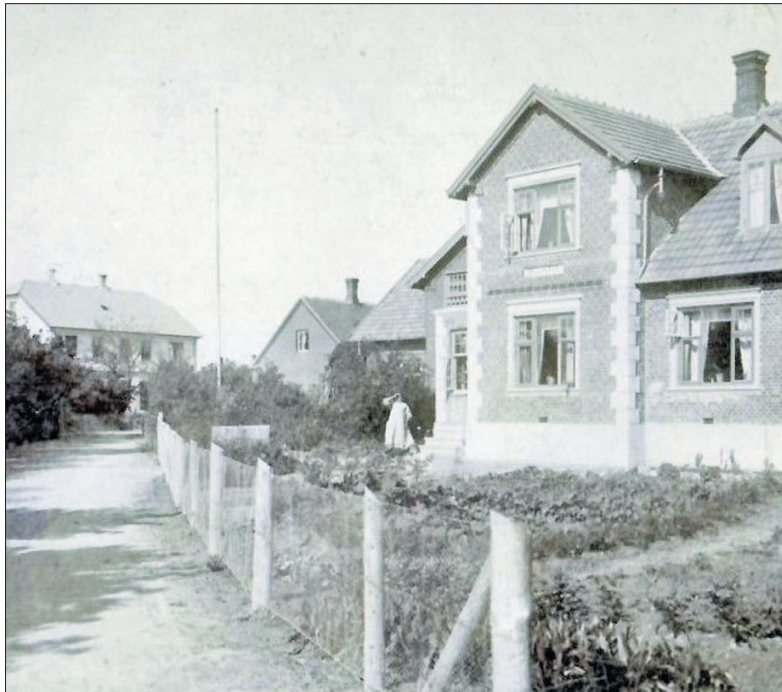
Breidablik 1914

Klintevej, også kaldet 'Strandvej', 'Hotelvej', 'Klinten' og 'Tyskervej', bliver gennem tiderne betrukt af badegæster,