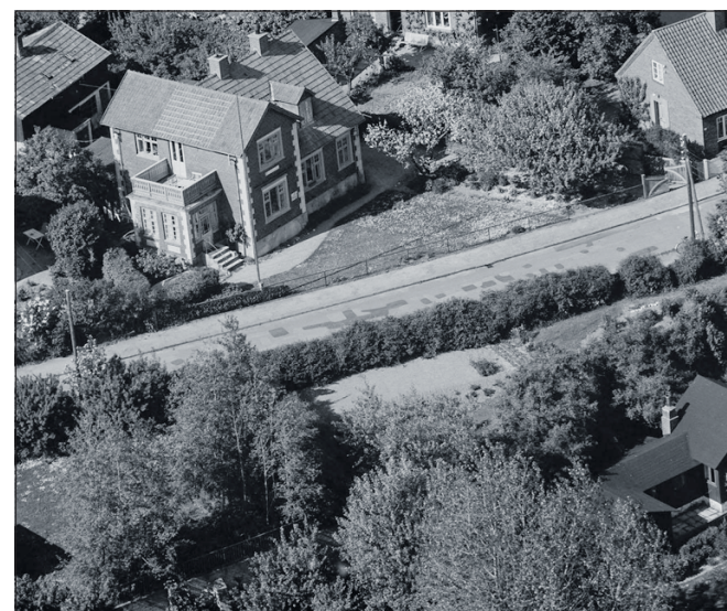
Breidablik 1955.