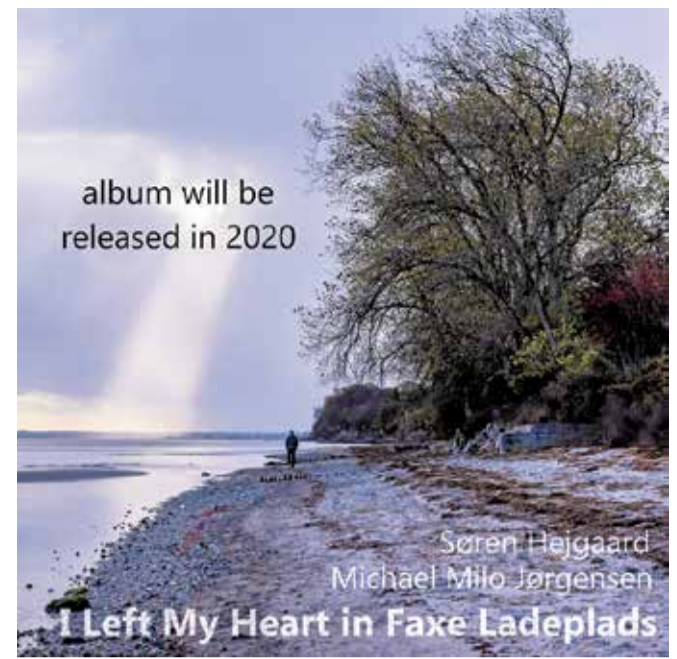
Dette smukke foto af Synnøve Rasmussen kommer til at præge den nye cd